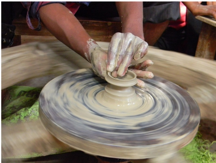
कुम्हार के चाक पर

सूरजमुखी समूह के कुछ बच्चों ने स्कूल में पढाई के कार्य के साथ-साथ किसी उद्योग के बारे में भी सीखने का निर्णय लिया है. वर्तमान में बच्चों के पास निम्न विकल्प हैं: